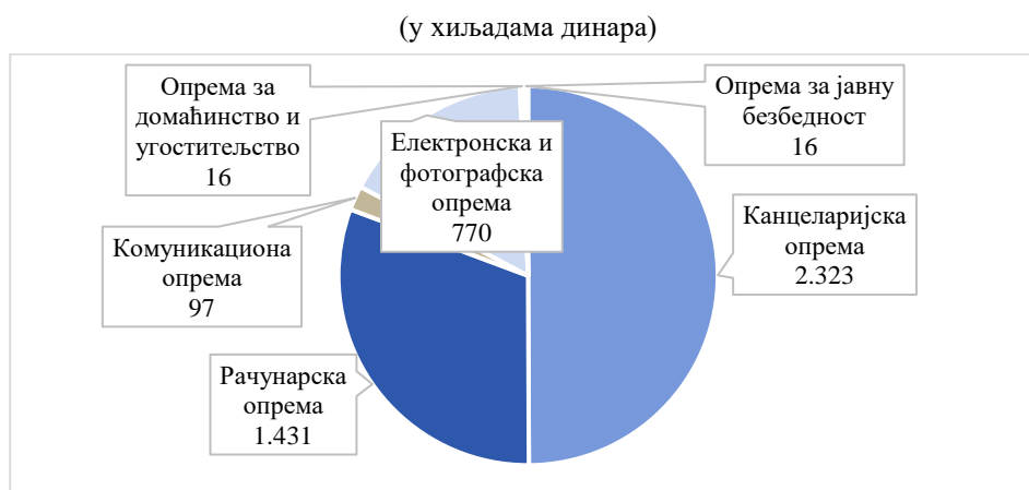
Графикон 2: Структура садашње вредности Опреме – конто 011200 Управног суда

Повећање опреме, односно издаци за набавку опреме исказани су у износу од 973 хиљаде динара. Осим тога, увећана је опрема у укупном износу од 566 хиљада динара, на основу Решења о преносу рачунарске опреме на коришћење без накнаде број 401-00-181/2020-18/18 од 2. новембра 2020. године. Наведену опрему (штампаче) је Министарство правде – Сектор за материјално финансијске послове – Одсек за инвестиције пренео на коришћење Управном суду. Сва новонабављена опрема укњижена је у пословне књиге Управног суда. (Ближе описано у оквиру тачке 3.1.3.1.1. Административна опрема – конто 512200)